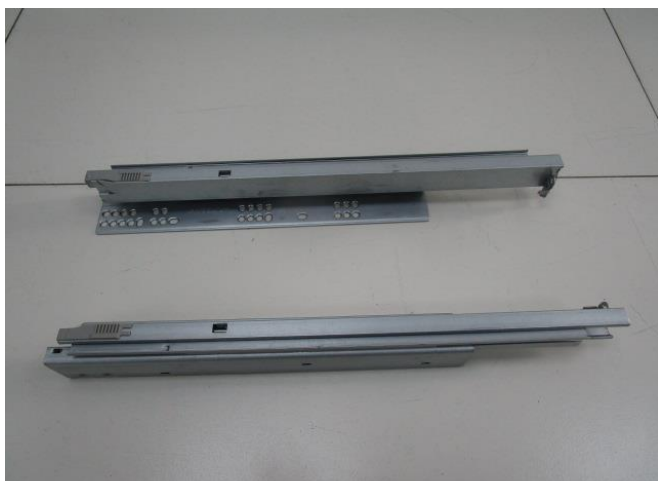
Pic 1: Front view