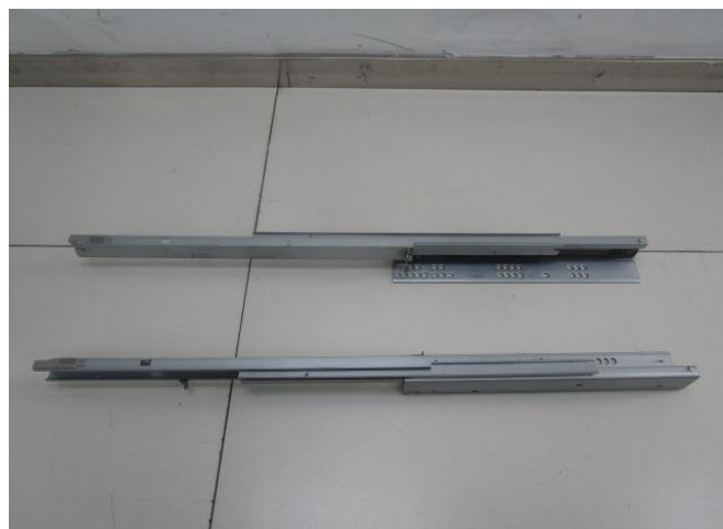
Pic 2: Extension view