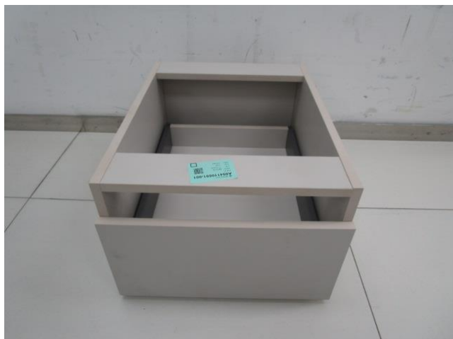
Pic 3: close